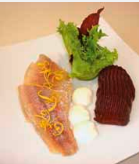
Perfekte Harmonie: Rote Bete und Räucherforelle

WIE WÄRE ES MIT ZWEI TOLLEN REZEPTEN AUS DER LEICHTEN KÜCHE?