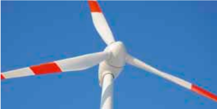
Windkraft kommt: In Höhn baut die rhenag drei neue Anlagen.