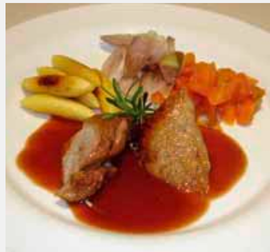
Zart und mild: die Putenkeule

Den Braten auf eine Fleischplatte offen im Herd etwas bräunen, die Soße warm stellen. Als Beilage empfehlen wir Ihnen glasierte Möhren und Schupfnudeln (oder Klöße).