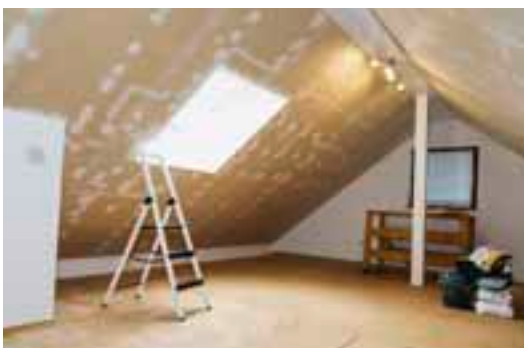
Das ausgebaute Dach ist hervorragend gedämmt.

enz so gut war, wie sie eigentlich sein sollte. Sein Haus besteht aus einer älteren und einer neueren Hälfte, es ist umfangreich umgebaut worden, das Dach hat er selbst ausgebaut. Hier könnten Wärmebrücken lauern, an denen viel Energie verloren geht – auch überall dort, wo unterschiedliche Stoffe wie Beton und Bimsstein aufeinandertreffen.